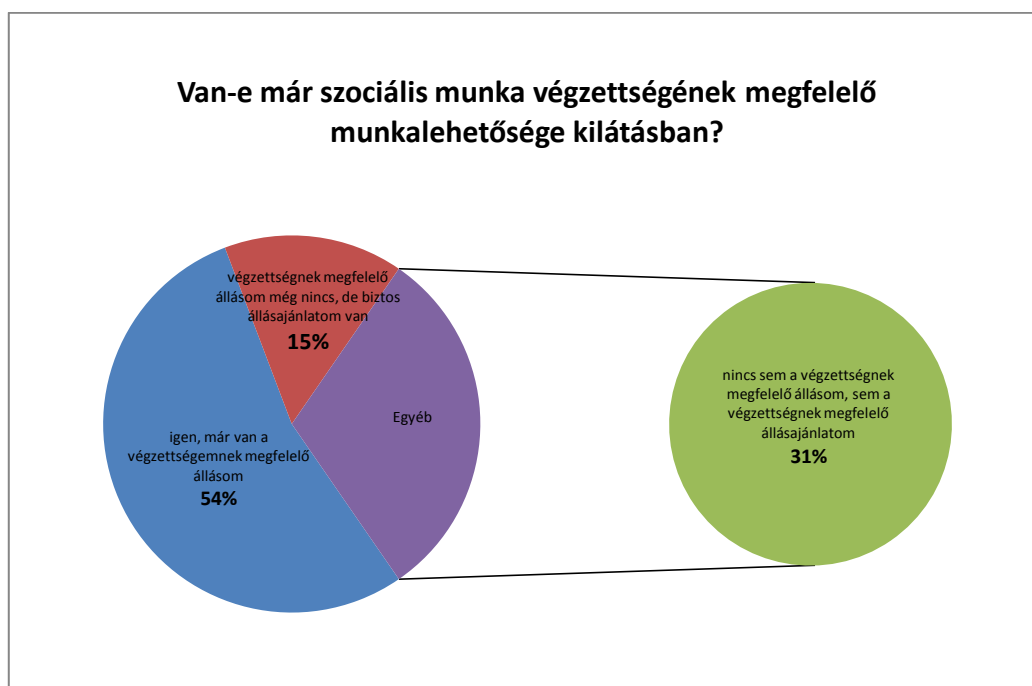
3. sz. ábra

Friss diplomásaink külföldi munkavállalási hajlandóságát is vizsgáltuk, és megkérdeztük, hogy a számukra releváns célország mely nyelvterületen helyezkedik el. Az eredmények alapján annyit mondhatunk, hogy a sikeres záróvizsgát tett hallgatók negyedénél tervebe van véve a külföldi munkavállalás, azonban ezt időben későbbre halasztották. Végzést követően rövid időn belül egyikük sem vállalkozna arra, hogy más országban vállaljon munkát, vagy lépjen ki a nyílt munkaerő-piacra. A hallgatók háromnegyede azonban ilyen irányú tervekről egyáltalán nem számolt be (4. sz. ábra).